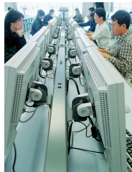
デスク上の金具にディスプレイが 取り付けられている

来、OA用のデスクの上に、学生用に17型CRT、分配表示用に15型CRTが設置されていたが、最近では授業でのパソコンの活用が増え、また学生の自習の割合も増加したことから、教員の間から端末を増やして欲しいという要望が出てきた。これに対し、限られたスペースの中でパソコンやディスプレイの台数を増やさなければならないということから、CRTのLCDへの置き換えを行うことにした。LCDに置き換えたことで、大宮校舎では従来540台だったディスプレイが、876台となり、一度に使用できる学生の数も格段に増え、授業での活用も多くなったということである。