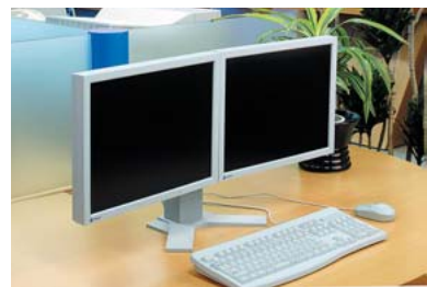
デュアルハイトアジャスタブルスタンド

EIZOのLCDには、使用環境、用途に合わせて設置方法を選べる、各種アーム／スタンドソリューションをご用意しています。